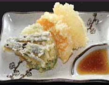
Yasai tempura gefrituurde groenten