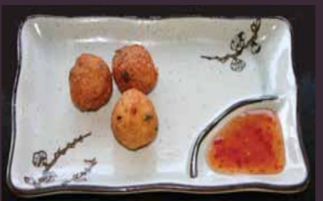
Yasai ball vegetarische balletjes