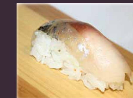
Saba nigiri makreel