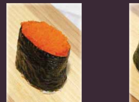
Masago gunkan viskuit