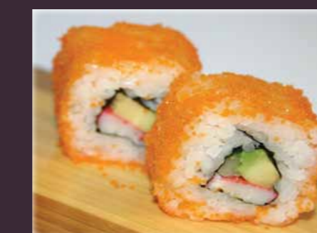
Carlifornia maki o.a. krabstick, avocado, komkommer (2st.)