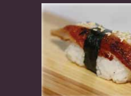
Unagi nigiri gegrilde paling