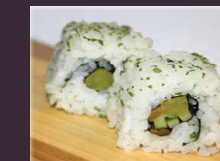
Yasai maki vegetarisch (2st.)