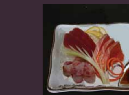
Sashimi mix mix (9 plakjes) € 5,50