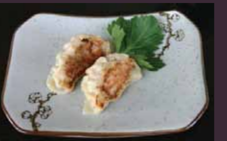
Gyoza vleespasteitje (2 st.)