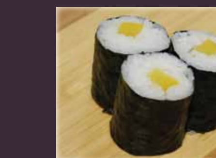
Oshinko maki Japanse rettich (3st.)