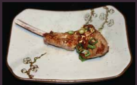
Kohitsuji lamskotelet (1st)