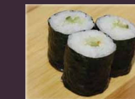
Kappa maki komkommer (3st.)