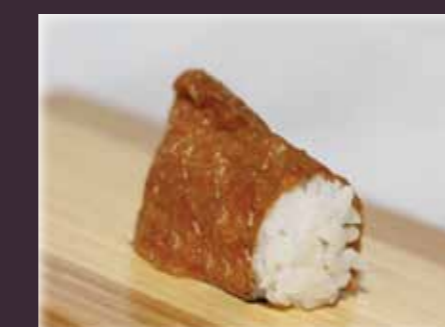
Inari nigiri zoete tofu-zakje