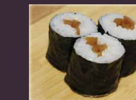
Kanpyo maki zoete groente (3st.)