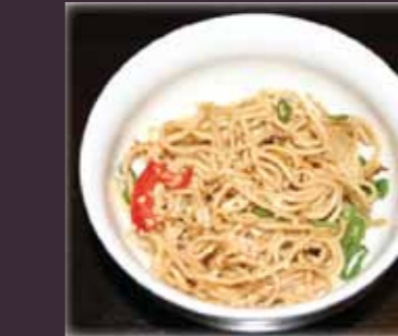
Yaki ramen gebakken mie