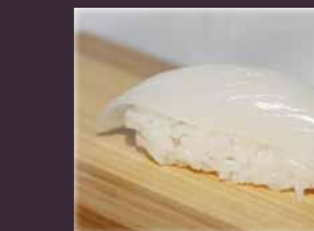
Ika nigiri inktvis