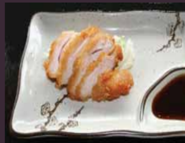
Chicken katsu kipschnitzel