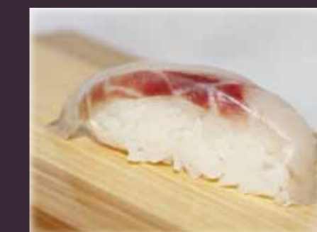
Suzuki nigiri zeebaars