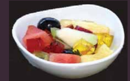
Fruit & Jelly vers fruit met jelly