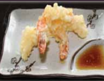
Ebi tempura gefrituurde garnaal (2st.)