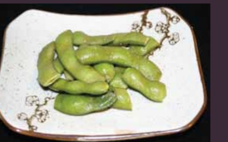
Edamame soyaboontje in dop