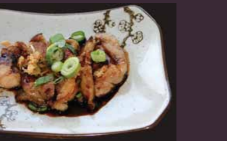
Tori teriyaki gegrilde kip