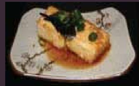
Agedashi tofu zachte tofu-blokjes (2st.)