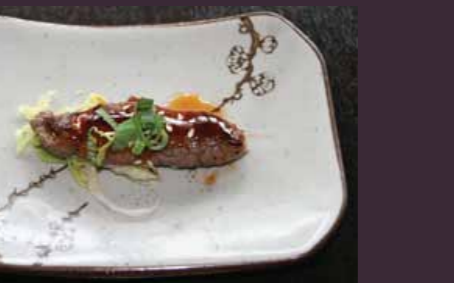
Usuyaki beef-rolletje (1 st.)