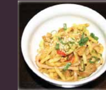
Chicken udon gebak. udon met kerrie en kip