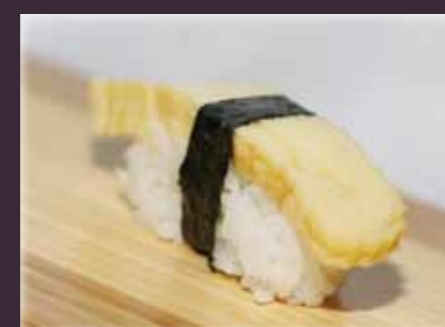
Tamago nigiri omelet