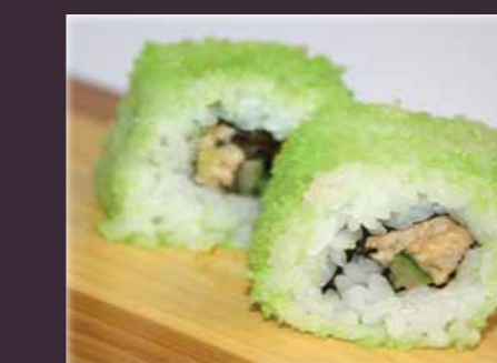
Spicy tuna maki tonijnsalade (2st.)