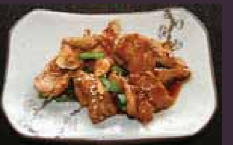
Butaniku yaki varkenshaas