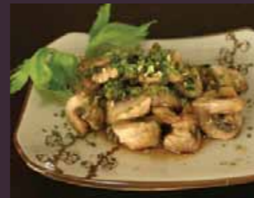
Yaki mushroom gebakken champignon