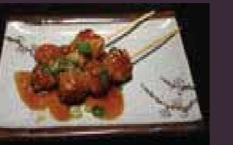
Tsukune kipballetjes-spies (2st.)