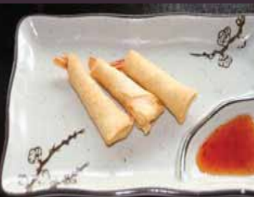
Ebi harumaki kleine garnalen-loempia (3st.)