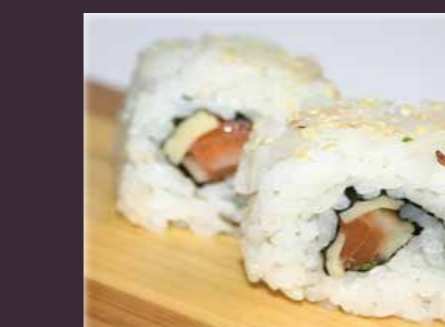
Sake cheese maki zalm kaas (2st.)