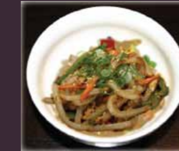
Yaki udon gebakken dikke rijstmie