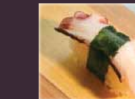
Tako nigiri octopus