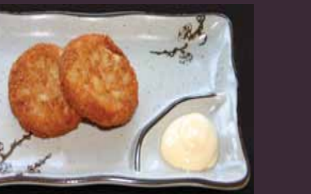
Jagaimo aardappelrosti (2st.)