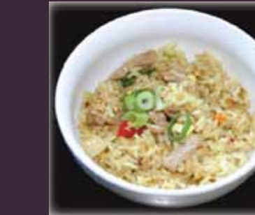
Butaniku rice gebak.rijst met varkenshaas