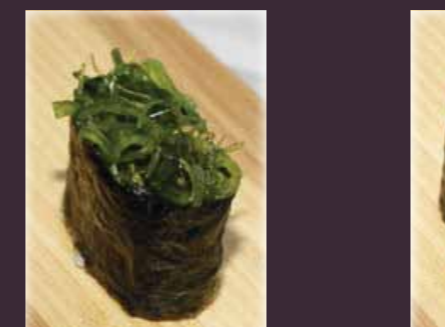
Wakame gunkan zeewier