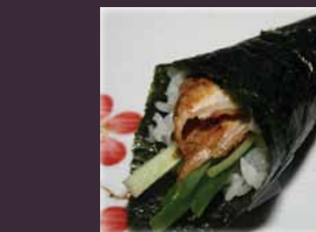
Unagi temaki gegrilde paling