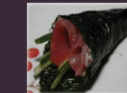
Maguro temaki tonijn