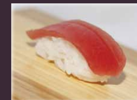
Maguro nigiri tonijn