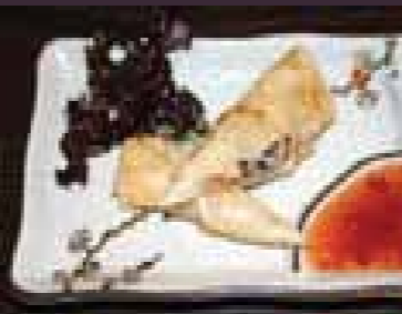
Harumaki Loempia (1st.)