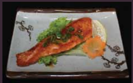
Sake teriyaki zalm van de tippan