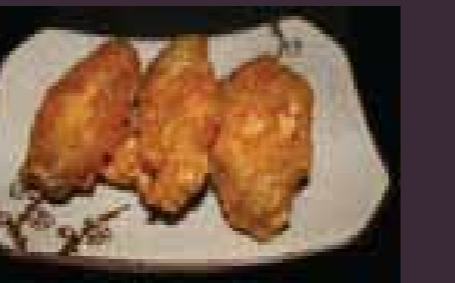
Tori teba kippevleugeltjes (3st.)