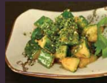
yaki yasai gebakken courgette