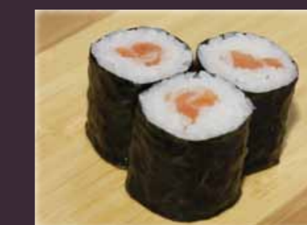
Tekka maki tonijn (3st.)