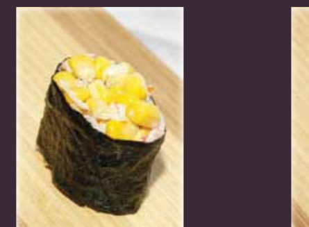
Corn gunkan maïs-salade