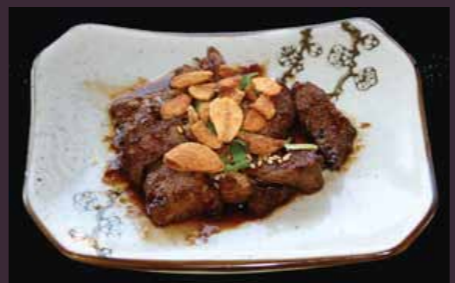
Gyuniku yaki ossenhaas