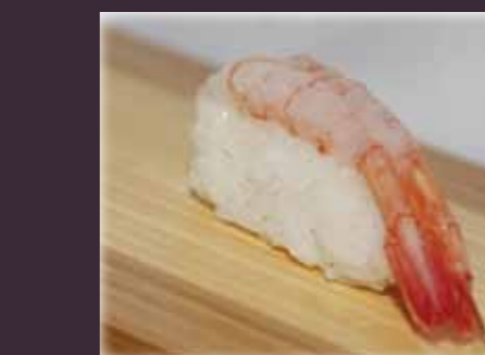
Ama ebi nigiri zoete garnaal