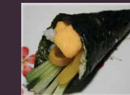
Yasai temaki vegetarisch