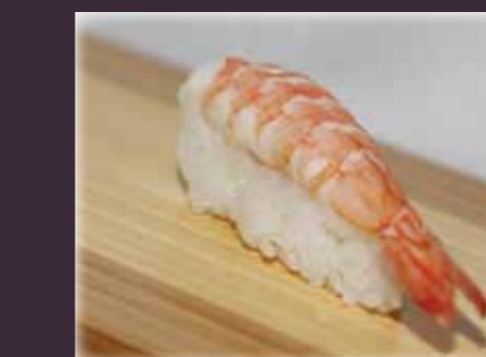
Ebi nigiri gekookte garnaal