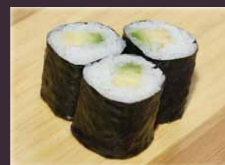
Avocado maki avocado