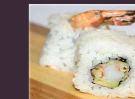
Ebi tempura maki gefrituurde garnaal maki (2st.)