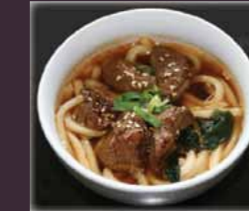
Niku udon udonsoep met ossehaas