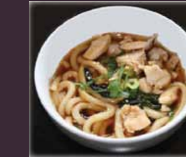
Niku udon udonsoep met kip