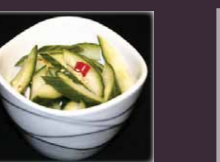
Kyuuri zoetzure komkommer