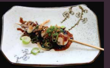
Ika kushi (1st.) inktvisspies