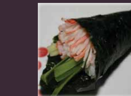
Carlifornia temaki krabstick