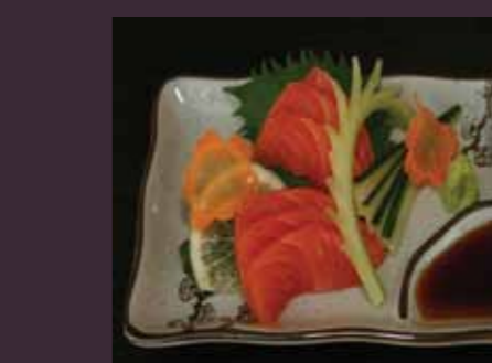
Sashimi sake zalm (6 plakjes) € 3,50