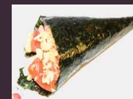
Crispy sake crispy zalm