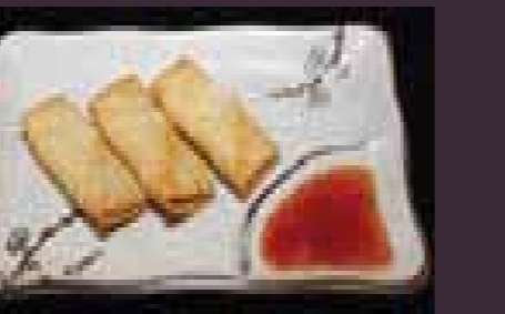
Mini-harumaki mini-loempia (2st.)