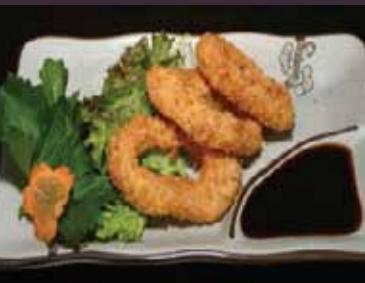
Ika fried gefrituurde inktvisring (3st.)