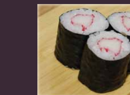
Kani maki krabstick (3st.)