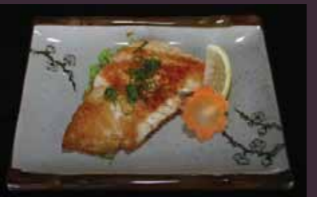
Suzuki yaki witvis van de tippan