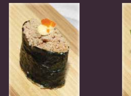
Maguro gunkan tonijnsalade