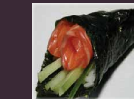
Sake temaki zalm