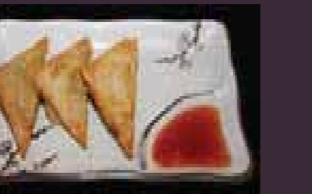
Curry trigon kerrie-driehoekjes (3st.)