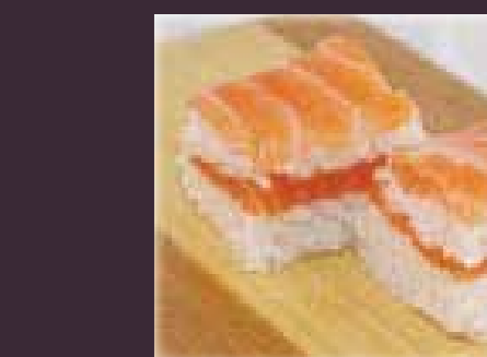
Smoked salmon gerookte zalm (2st.)