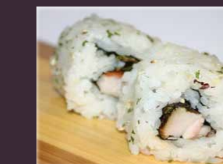
Spicy chicken maki pikante kip (2st.)