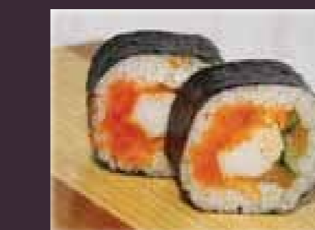
Futomaki o.a. krabstick, omelet, kanpyo (2st.)