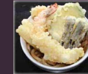
Tempura udon udonsoep met tempura