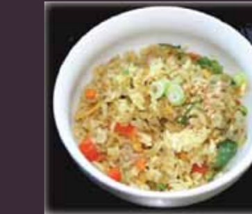
Chicken rice gebak.rijst met kerrie en kip