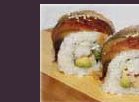
Unagi roll o.a. paling, krabstick, avocado (2st.)