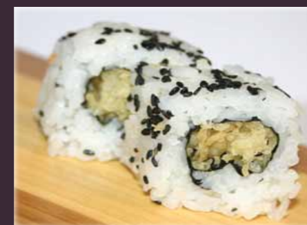
Crispy maki krokante maki (2st.)