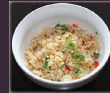
Yaki meshi gebakken rijst