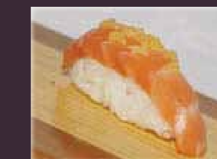
sake-cheese nigiri zalm kaas