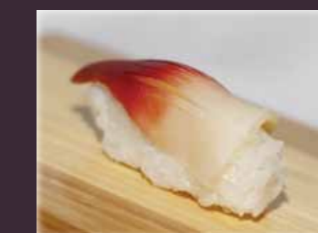
Hokkigai nigiri surfmossel