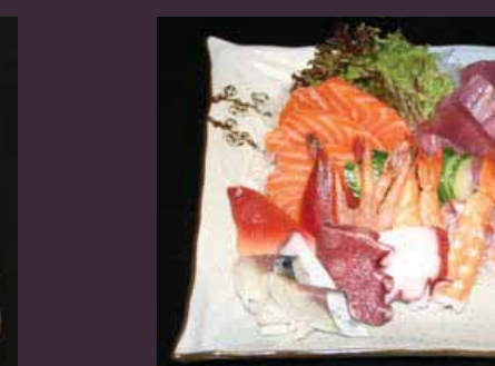
Sashimi dai sashimi groot € 10,00