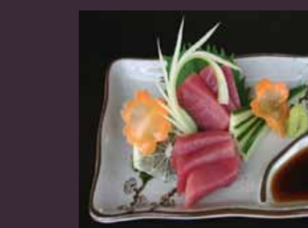
Sashimi maguro tonijn (6 plakjes) € 4,50