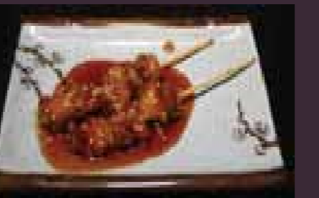
Yakitori kipspies (2st.)