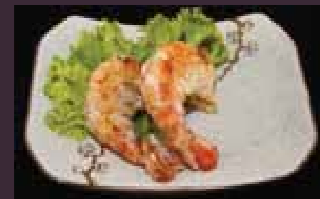
Yaki ebi gegrilde garnaltjes