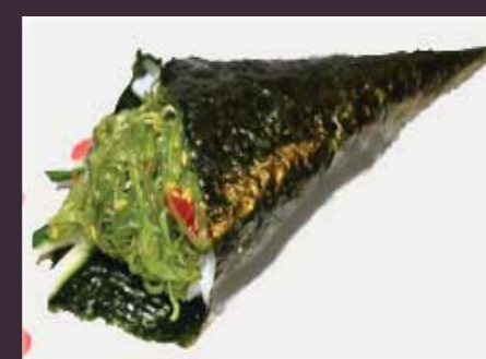
Wakame temaki zeewier