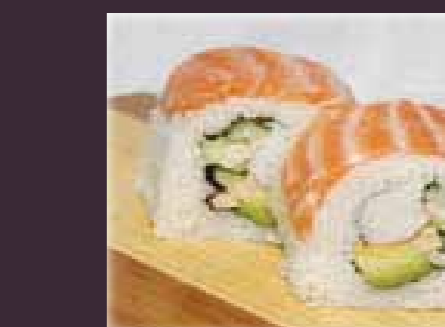
Sake roll o.a. zalm, krabstick, avocado (1st.)