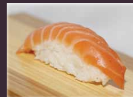
Sake nigiri zalm