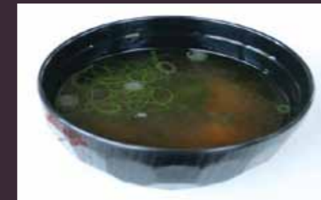
Miso soep Japanse soep