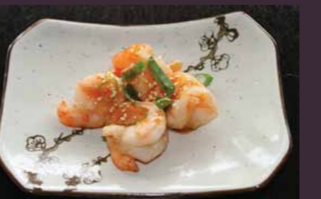
Ebi chili garnaltjes in chilisaus