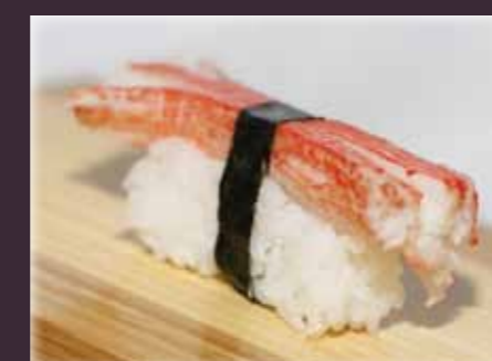
Kani nigiri krabstick